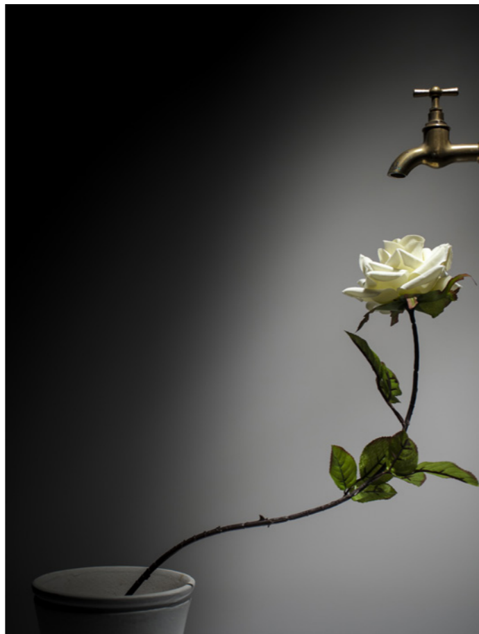
Sed de ti

Director de las Salas de Exposiciones de la UNED de Calatayud