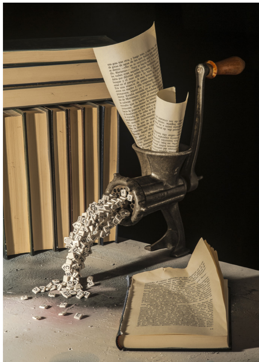
El devorador de libros