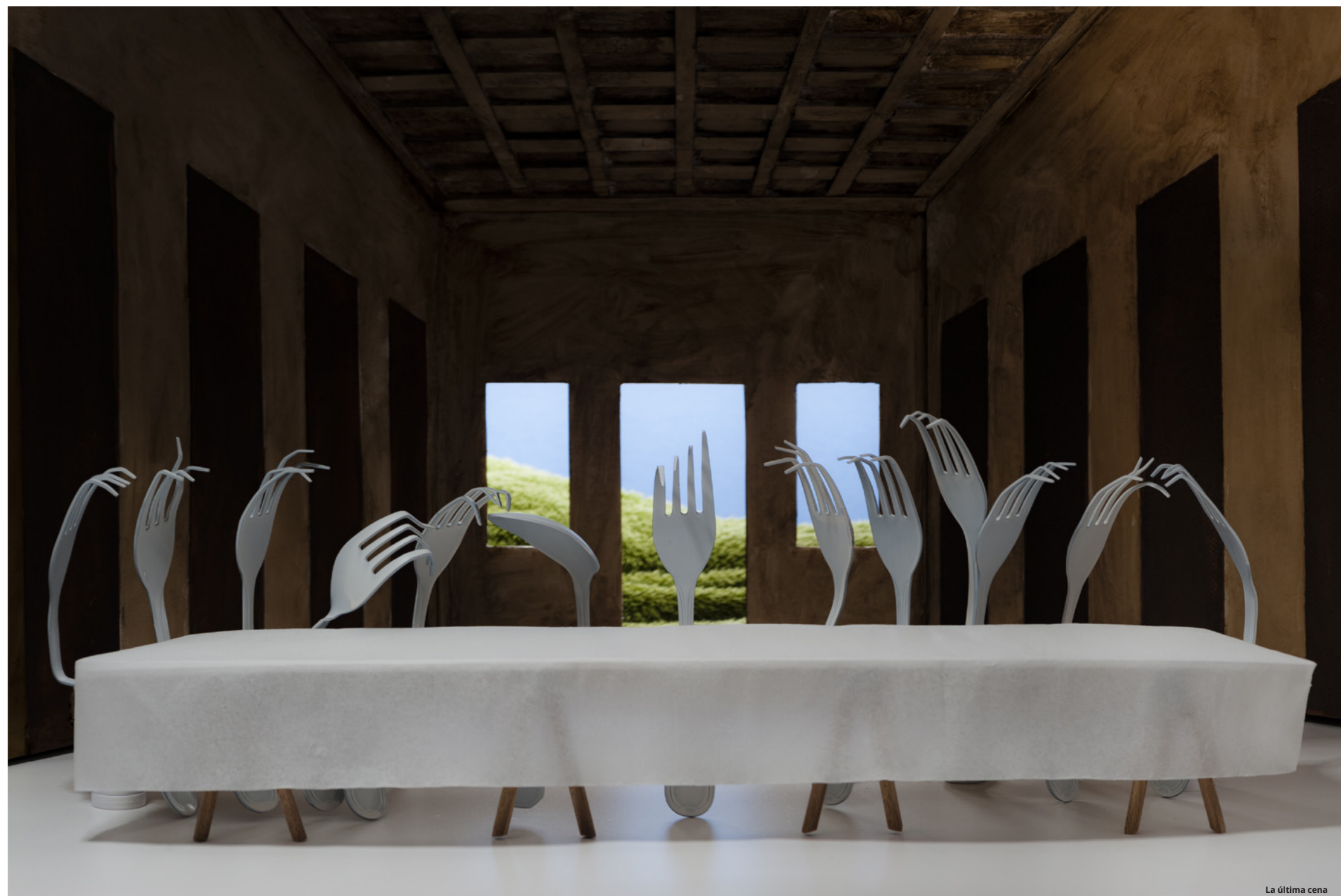
La última cena