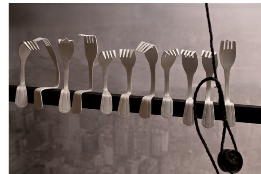
Lunchtime a top skyscraper